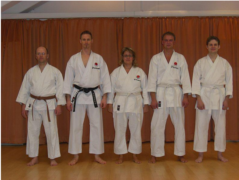
Der Anfang im Mai 2011!