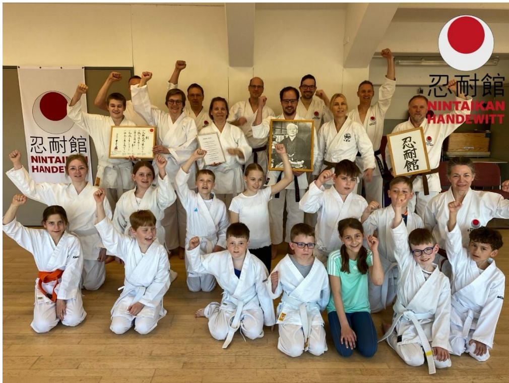
Das Dojo im Jahr 2025!